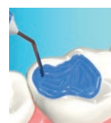
Totalets (fosforsyra på både emalj och dentin)