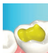
Självetsande (utan fosforsyra)