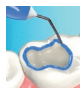
Selektivetsning (fosforsyra på emalj)