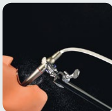
Z95L Switch jetstråle